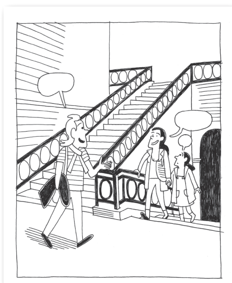
Élise et Horace (p. 45)