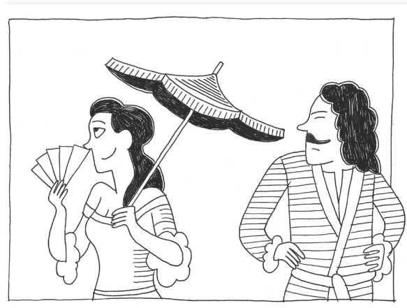
Armande Béjart et Molière (p. 30-31)