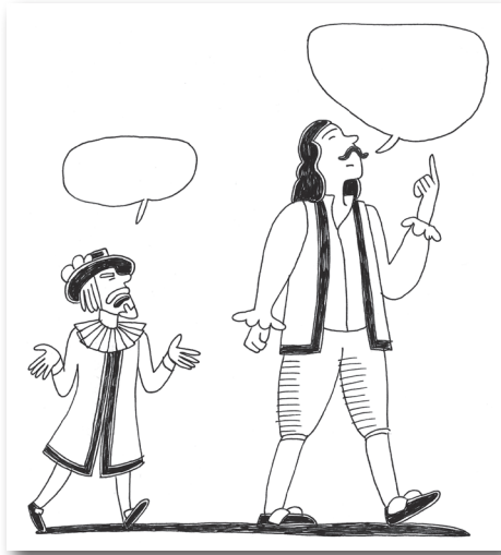
Molière et son père (p. 15)